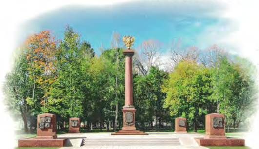
Стела «ГОРОД ВОИНСКОЙ СЛАВЫ»